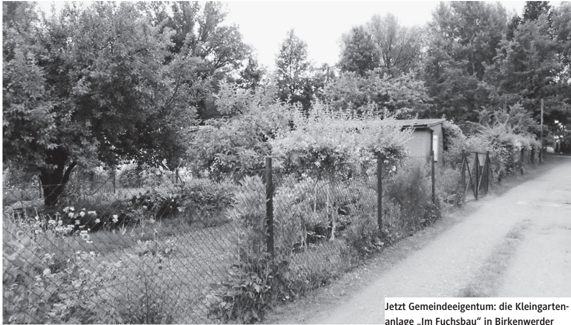
Jetzt Gemeindeeigentum: die Kleingartenanlage „Im Fuchsbau“ in Birkenwerder